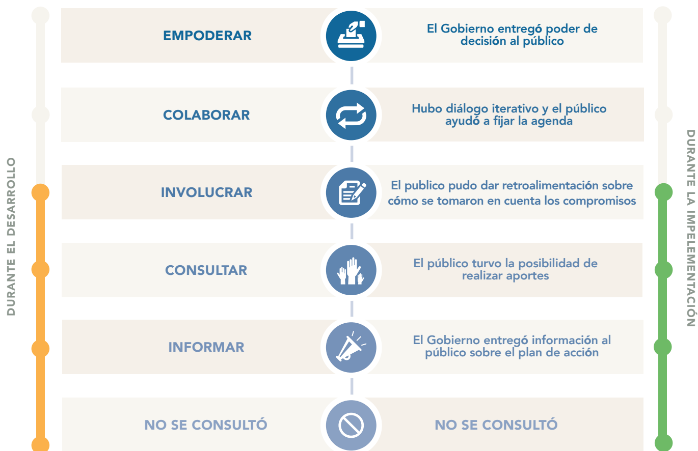
Table 2.2 | Nivel de participación pública

El MRI ha adaptado el Espectro de Participación de la Asociación Internacional para la Participación Pública (IAP2) para el uso de la AGA. La tabla a continuación muestra el nivel de influencia pública en el plan de acción. De abajo hacia arriba, las características de la participación son acumulativas. En el marco del gobierno abierto, los países deben aspirar al nivel de 'colaborar'; (No se espera que los países de la AGA alcancen el nivel de 'empoderar').