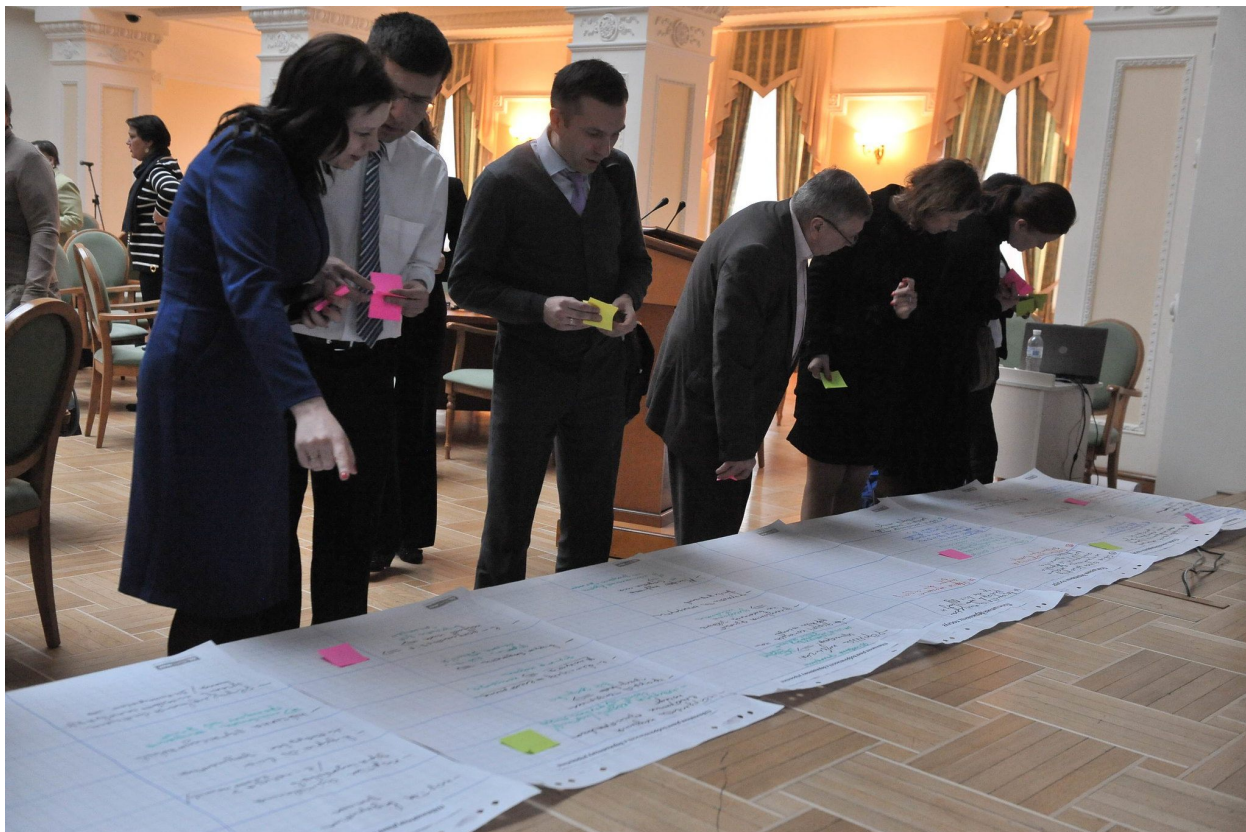
Украинские реформаторы обсуждают идеи на мероприятии Независимого механизма отчетности в 2016 году.