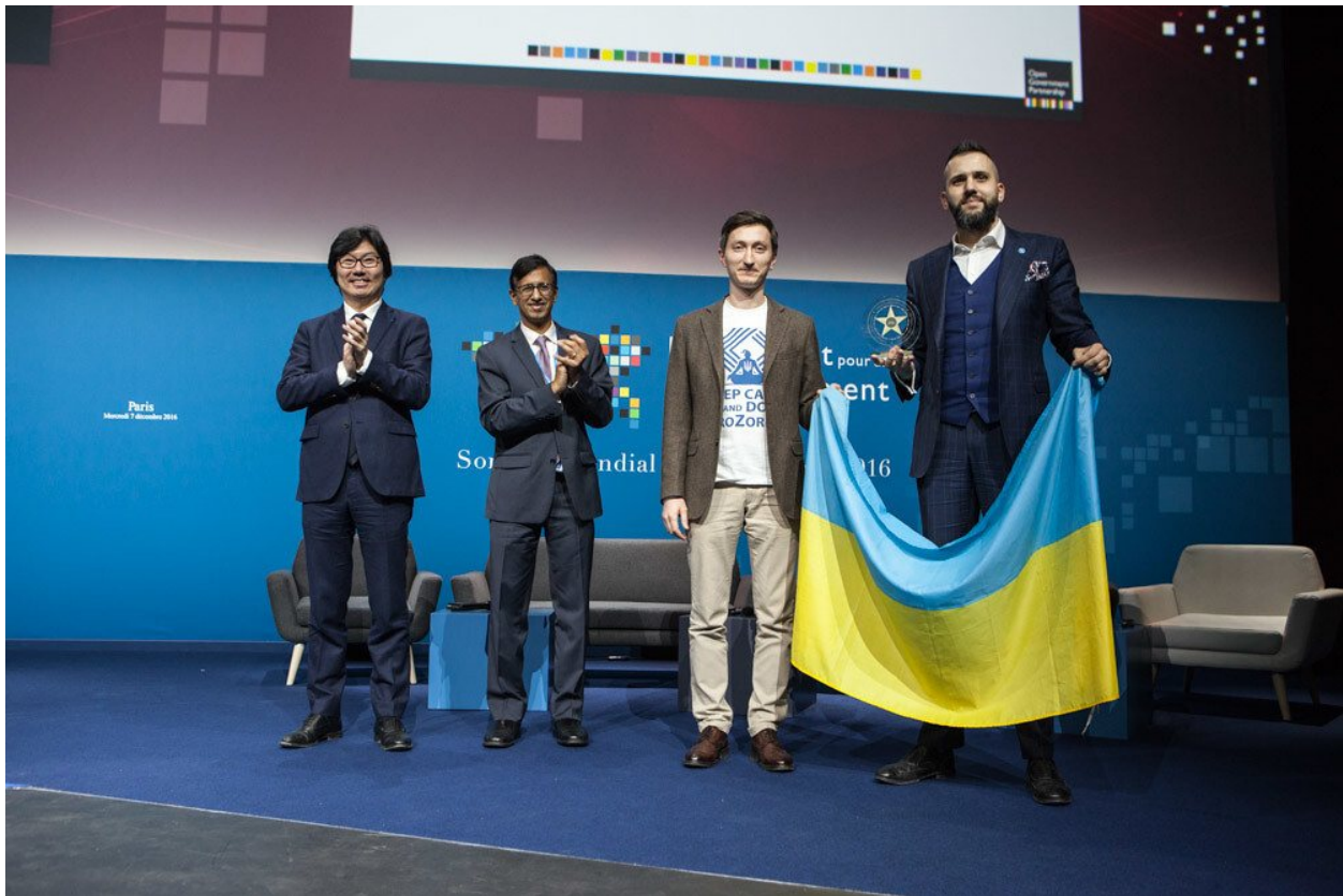
Украинские реформаторы делятся идеями на мероприятии Независимого механизма отчетности в 2016 году.

прозрачности в последующие годы. Закон об открытых данных установил базовую правовую основу для публичного доступа к государственным наборам данных и разрешил их бесплатное повторное использование. Это поспособствовало созданию множества инструментов для отслеживания государственных расходов и общественного контроля. Несколько государственных учреждений начали публиковать ключевые наборы данных, среди которых ряд государственных реестров Министерства юстиции и наборы налоговых данных Налоговой службы. Гражданское общество работало совместно с государственными учреждениями над разработкой удобных для пользователя ИТ-инструментов для отслеживания с использованием доступных открытых данных.