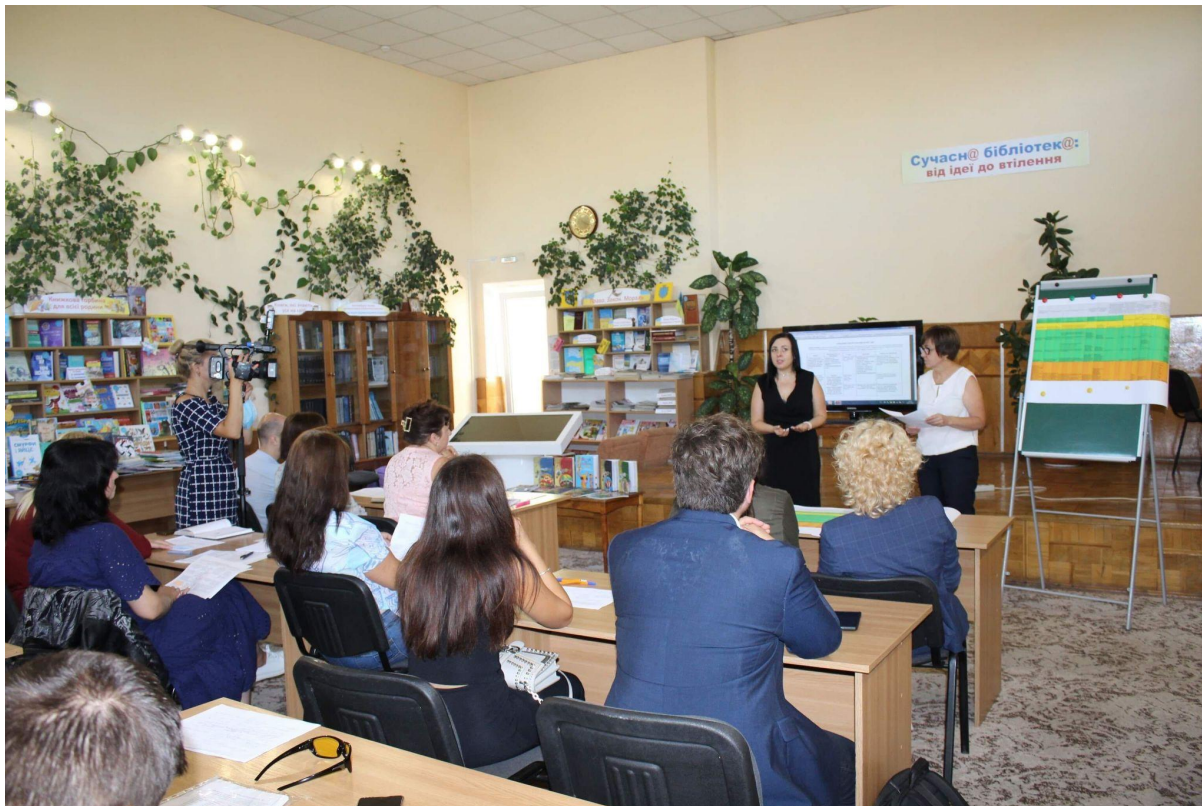
Команда Хмельницького на фінальному заході по спільній розробці плану дій OGP в 2021 році.

Разумеется, это не значит, что до войны в Украине не было серьезных внутренних проблем. Борьба с коррупцией была далека от победы, многие из тех, кто обходил систему, по-прежнему оставались безнаказанными, а политическое соперничество и корыстные интересы регулярно препятствовали прогрессу. Но стремление к переменам и готовность бороться за них в разных слоях общества были реальны и ощутимы.